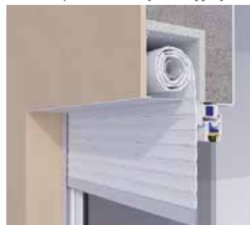
Montaż pod warstwą izolacyjną