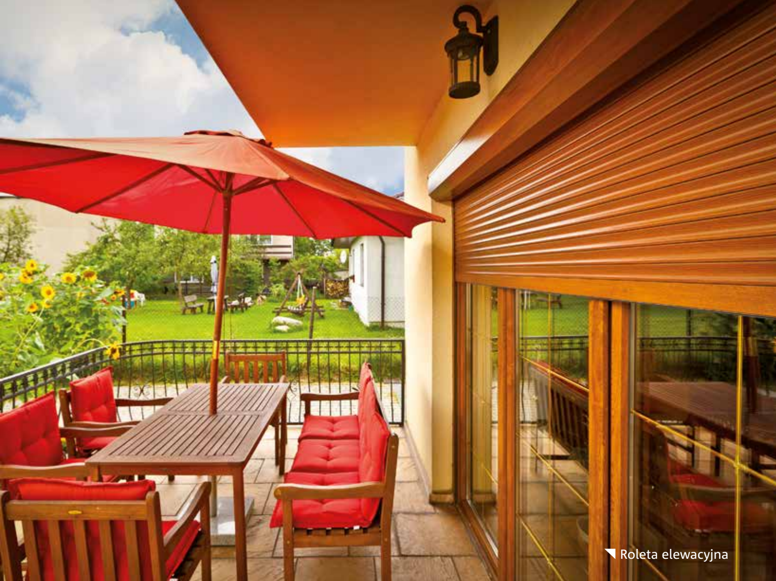
▼ Roleta elewacyjna