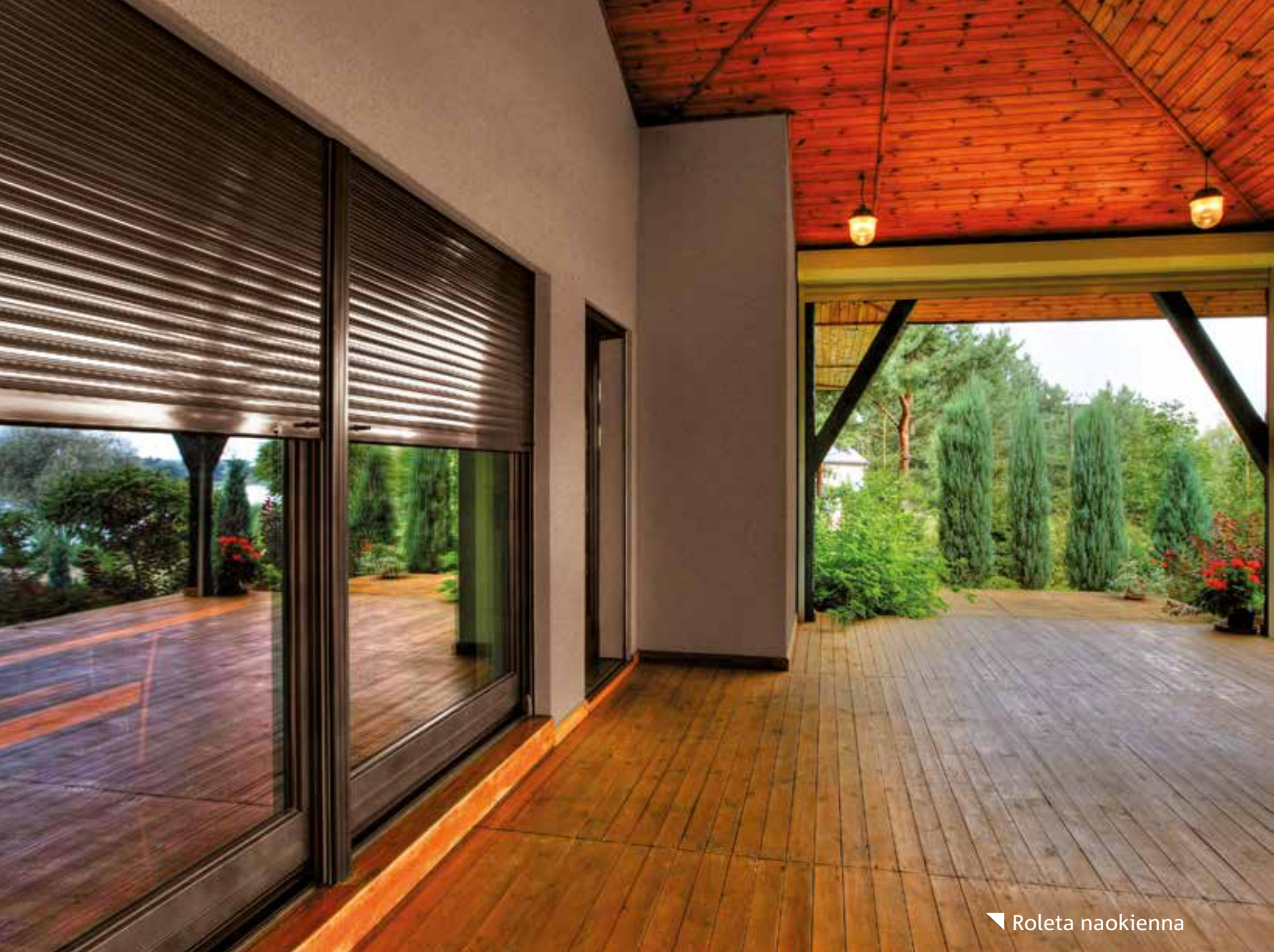
▼ Roleta naokienna