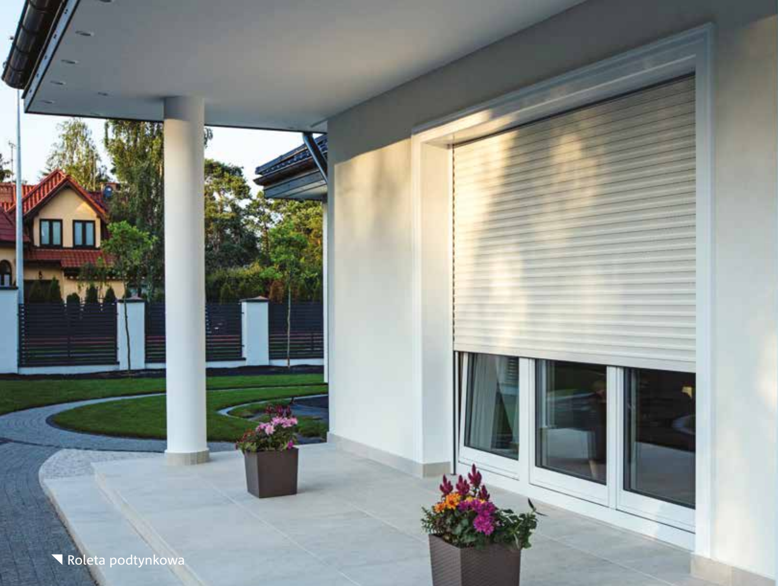
▼ Roleta podtynkowa